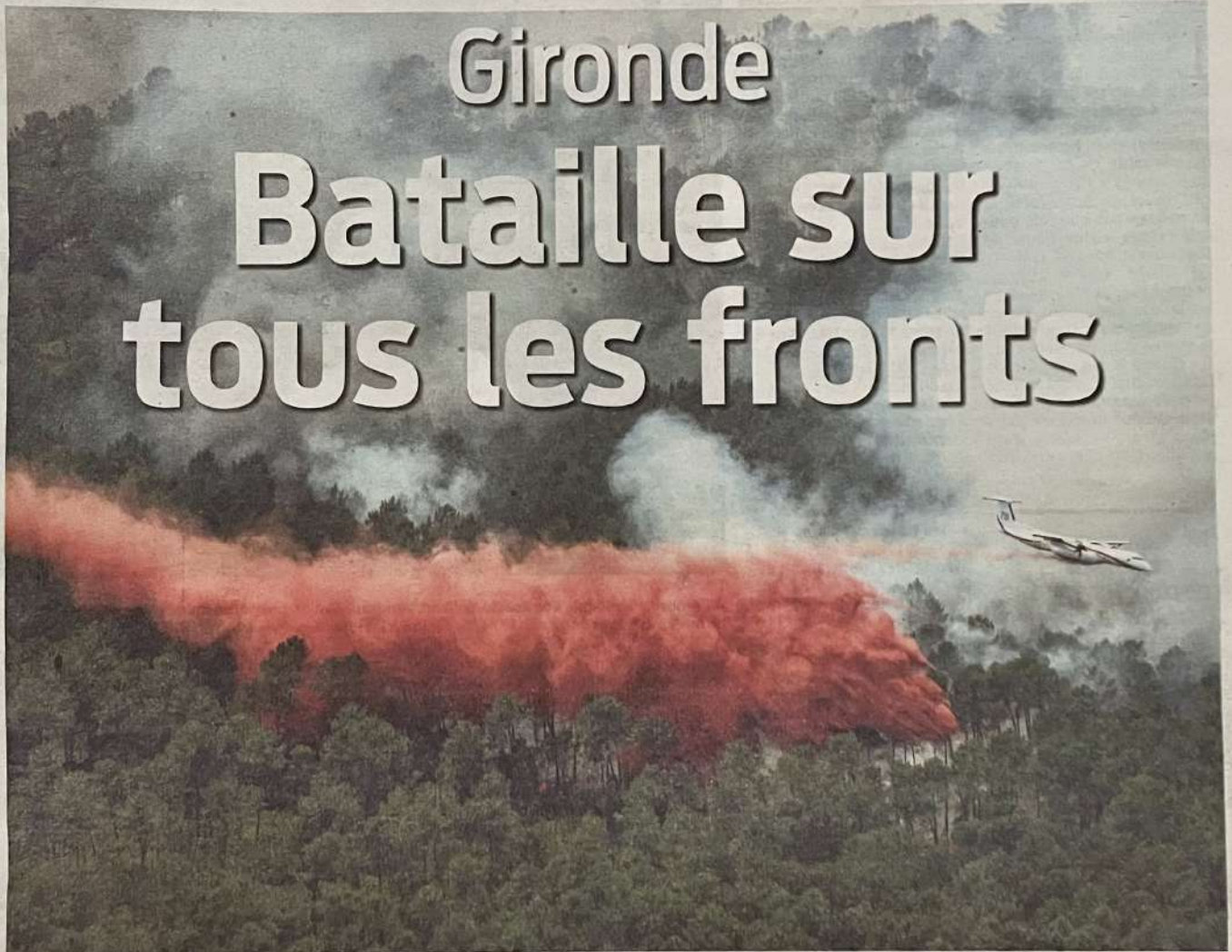
Hier, dans le secteur de Landiras en Sud-Gironde : un avion Dash largue du produit retardant pour éviter la propagation des flammes.