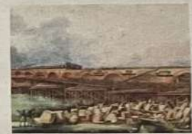
ARCHIVES DE BORDEAUX MÉTROPOLITAIN

Une grande collecte d'archives sur l'histoire des ponts