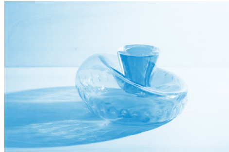
RADI Designers Vase Transparent cakes 2005 Édition Tools galerie Verre Achat de la Ville de Bordeaux Inv. 2016.11.3