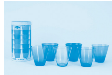
Kaj Franck (1911 - 1989) Verres 2744 (1953 - 1967) Édition Nuutajarvi Verre soufflé Achat de la Ville de Bordeaux, 2019 Inv. 2019.3.1 à 6