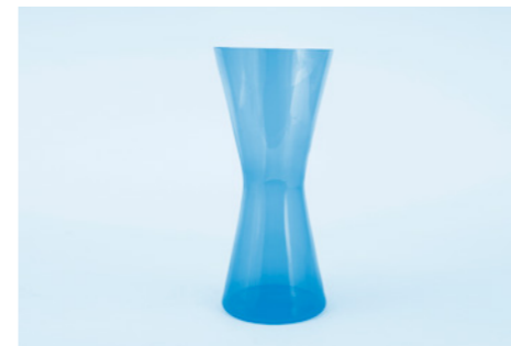
Kaj Franck (1911 - 1989) Vase 1405, Maljakko (1954 - 1967) Édition Nuutajarvi Verre soufflé Achat de la Ville de Bordeaux, 2019 Inv. 2019.3.21