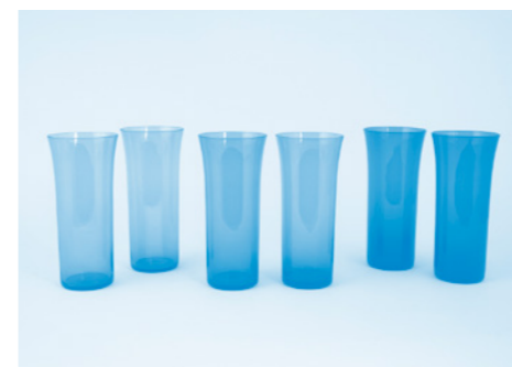
Kaj Franck (1911 - 1989) Verres Juomalasi (1958 - 1967) Édition Nuutajarvi Verre soufflé Achat de la Ville de Bordeaux, 2019 Inv. 2019.3.10 à 15

En 1961, dans les colonnes du magazine Beautiful home , le designer finlandais Kaj Franck s'exprimait : « Un design produit en série ne devrait pas être quelque chose dont les gens se lassent. Il devrait être si pertinent qu'il dure des années et des décennies et si discret que l'utilisateur ne sache pas qui l'a conçu. La marque de la société éditrice devrait suffire ». Ces verres, simples et élégants, correspondent à sa définition de la beauté : « nécessaire, fonctionnelle, justifiée et juste » (Kaj Franck, Kaj Franck, designer : April 16-October 12, The Museum of Modern Art, 1992). Ces objets aux formes essentielles, épurées et fonctionnelles sont le reflet de l'engagement du designer en faveur d'un design abordable. La couleur est une composante essentielle de cet ensemble. Kaj Franck joue sur la transparence du verre, combine et superpose les teintes. Ces pièces, icônes d'un design démocratique produit en très grand nombre, font logiquement partie de nombreuses collections muséales comme celles du Musée des Arts Décoratifs de Paris ou du MoMA à New York.