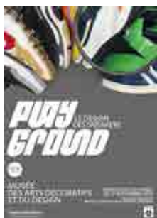
ED. LA TENGO

une forme urbaine de confort, de créativité, de jeunesse et d'égalité entre les genres. Elle s'est d'abord répandue dans les milieux artistiques, innovants, branchés. À la fois ergonomique et asexuée, elle continue à exprimer une énergie positive, du fait du lien originel avec les pratiques sportives, puis avec le style rappeur lui aussi venu des États-Unis, tout en s'imposant comme un objet culte à haute valeur ajoutée créative, comme le montre le foisonnement des éditions limitées de sneakers qui déclenchent les passions parmi les jeunes du monde entier. D'autre part, la diversité des formes et des matériaux autorisée par les progrès de la technologie et la modélisation 3D donne aux modèles de sneakers contemporains le statut d'objets de design à part entière, preuve en sont les expositions qui leur sont consacrées. L'alliance entre confort extrême, design innovant et stratégies marketing redoutables laisse penser que ce phénomène est parti pour durer, surtout qu'il touche désormais toutes les générations. »