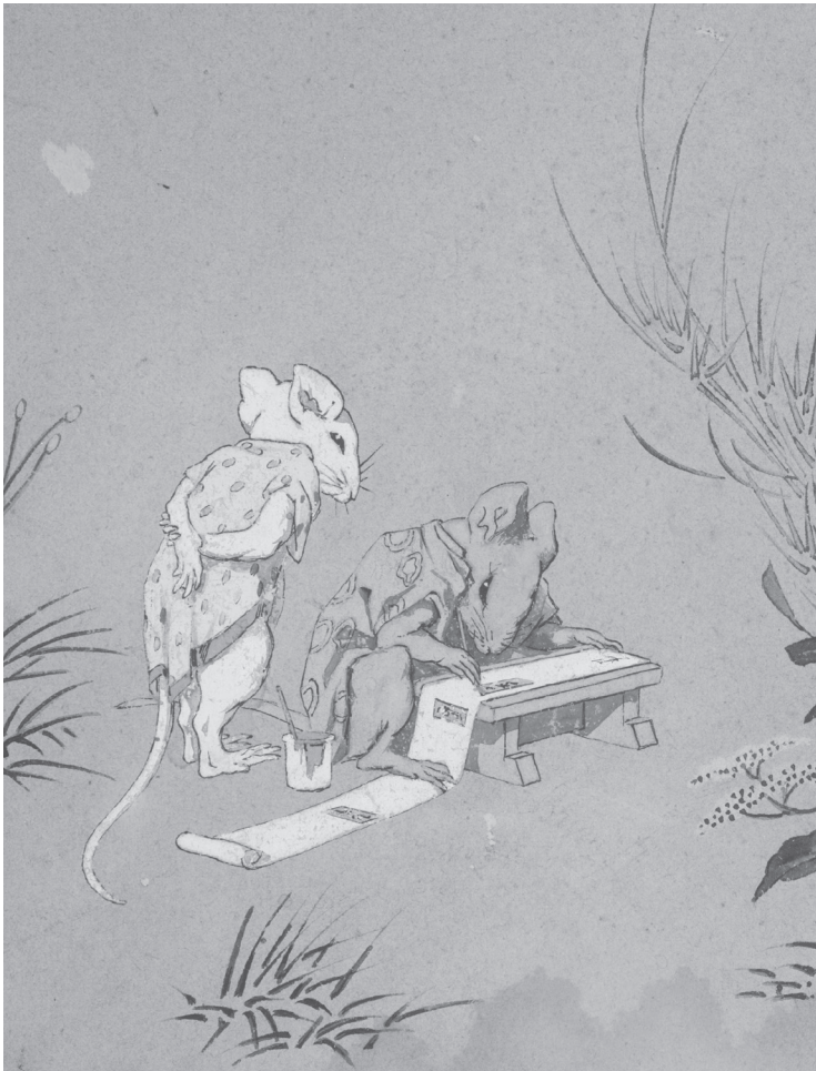
Eugène Millet, Dessin préparatoire à une coupe Décor Souris (détail)