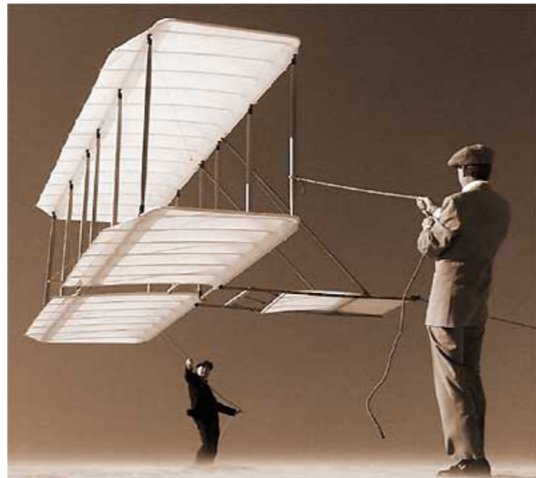
Epreuves de planeur à Kitty Hawk réalisées par les frères Wright, 1901.