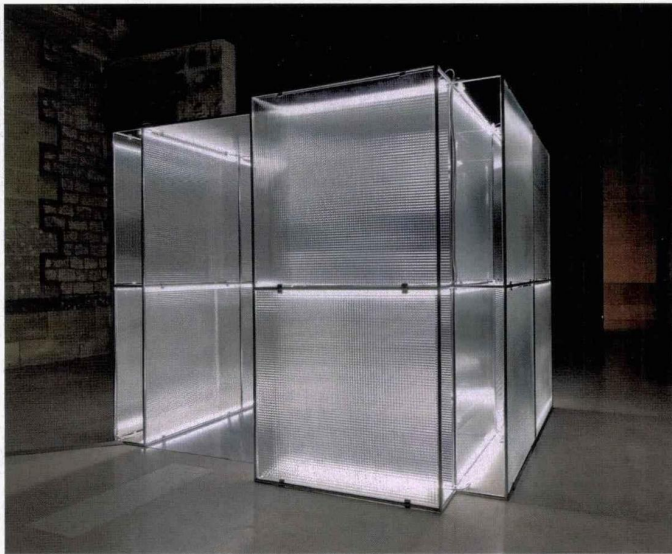
Ambiente Cronotopico, 1968-2021, verre, métal et néon