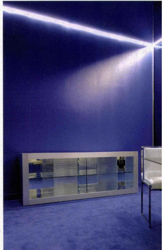
Buffet Cronotopo , édition Driade, 1971, aluminium, étagères et portes en verre, intérieur en miroir, Courtesy of Gorilla Collection.