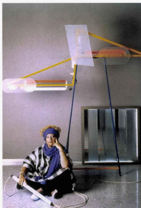
Nanda Vigo prenant la pose sous l'objectif du photographe Gabriele Basilico à Milan, en 1984, pour illustrer la couverture de la revue Domus n° 653.

L e musée des Arts décoratifs et du Design de Bordeaux rend hommage à une figure créative géniale, inclassable et méconnue du grand public : Nanda Vigo (1936-2020). Pionnière de l'avant-garde italienne dès les années 1960, elle a navigué entre les disciplines, pour mieux explorer la notion d'espace, en modifier la perception, en faire un environnement où vivre, agir, réagir, par tous les moyens artistiques à sa disposition. Une perception critique, politique, manifeste et poétique du cadre de vie, qui la mènera à pratiquer autant l'architecture intérieure que le Design radical, mouvement artistique et architectural qui émerge en Italie dès les années 1960. À cette époque, des architectes et intellectuels se tournent alors vers la discipline du design, y voyant là un domaine ouvert à la recherche et à l'in-