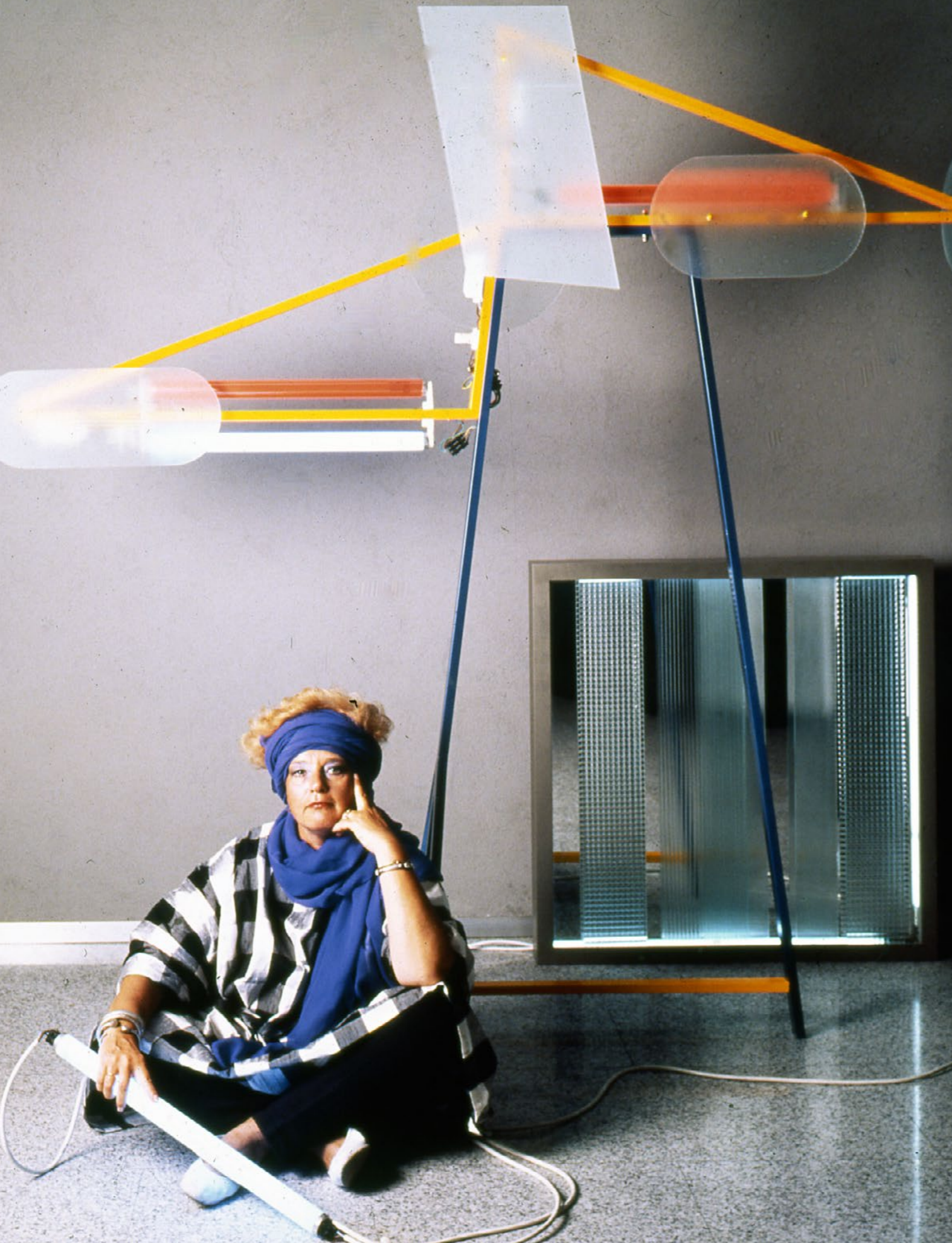
Portrait de Nanda Vigo, couverture de Domus n°653 , Milan, 1984

Les créations de Nanda Vigo sont présentées en permanence au Museo del Design de la Triennale à Milan, dans la collection du ministère des Affaires étrangères italien, au Museo del Novecento de Milan et au Castello di Rivoli. En 2014, elle expose au Guggenheim Museum de New York dans le cadre de la rétrospective consacrée à ZERO. En 2015, à l'intérieur du programme de l'exposition Zero. Die Internationale Kunstbewegung der 50er und 60er Jahre , elle expose au Martin-Gropius-Bau de Berlin et au Stedelijk Museum d'Amsterdam.