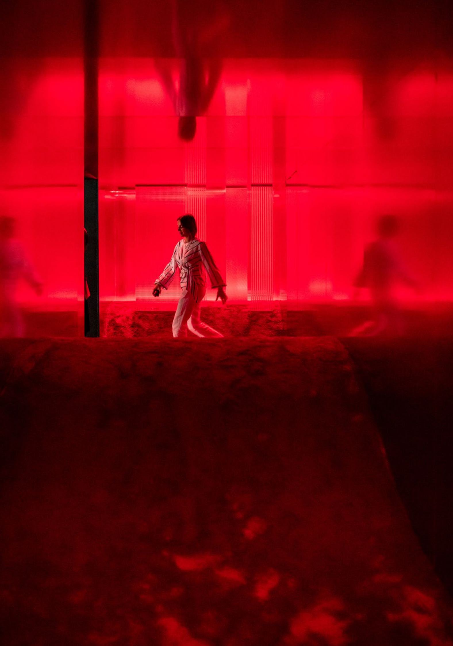
Lucio Fontana et Nanda Vigo, vue de l'installation Ambiente spaziale : « Utopie », nella XIII Triennale di Milano, 1964-2022 Reconstruction autorisée par