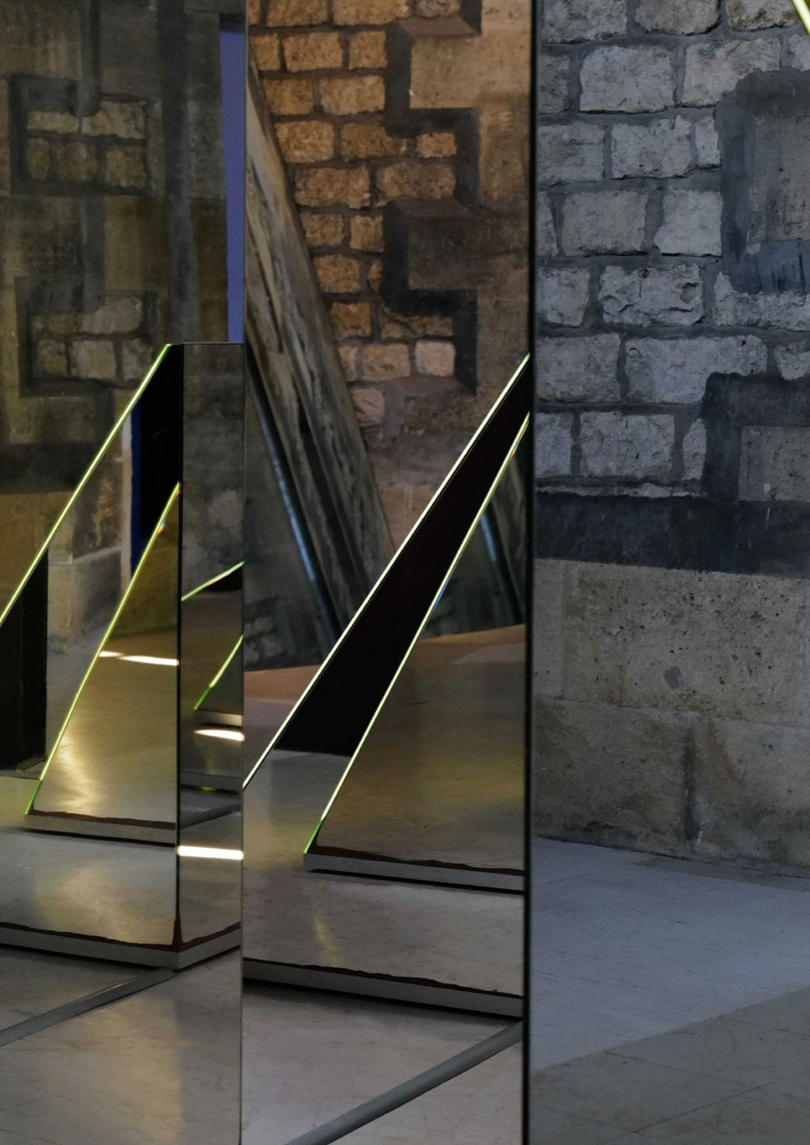
Nanda Vigo, Trigger of the Space , 1974 – Courtesy of private collection Milano & Archivio Nanda Vigo, Milan © Valérie Sadoun